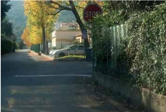
STOP au croisement avenue des Écoles et rue de la Gare