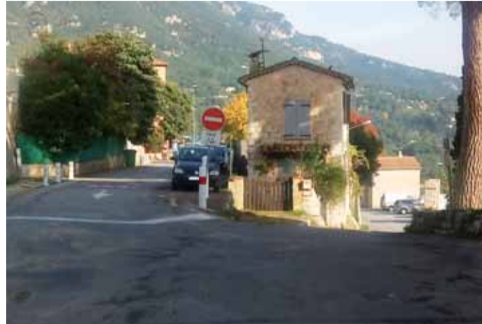
Avenue des Écoles en SENS INTERDIT